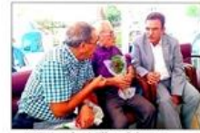
CHP Antalya Milletvekili Çetin